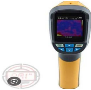
Gambar 2.3 Thermometer AMT320

Thermometer AMT 320 biasa disebut termometer inframerah dan ada juga yang menyebut thermometer laser adalah sebuah alat ukur suhu yang dapat mengukur temperatur / suhu suatu objek / material tanpa harus menyentuhnya.