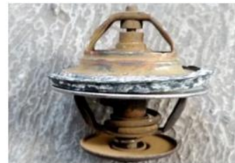
Gambar 3.2 Kondisi Thermostat yang mengalami kerusakan