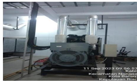
Gambar 2.2 Genset perkins 800 kVA Stamford

Genset Perkins 800 kVA adalah generator set yang berfungsi untuk menghasilkan daya listrik alternatif ketika pasokan listrik dari pembangkit listrik umum mati atau saat diperlukan tambahan pasokan listrik di wilayah tertentu.