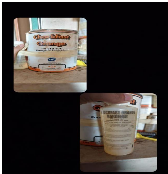
Gambar 1 alat dan bahan