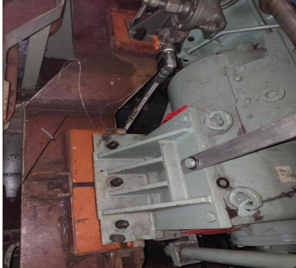
Gambar 4 hasil pemasangan