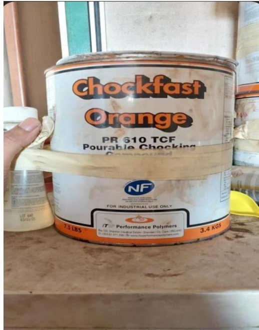
Gambar 2 Chockfast dan Hardener