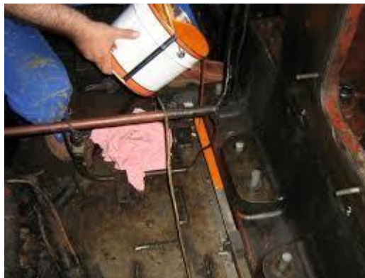
Gambar 3 pemasangan Chockfast Orange

Berikut tahap selanjutnya proses pemasangan bahan ke dalam dudukan mesin yang berfungsi sebagai dudukan semua jenis dan ukuran mesin dan Chockfast Orange digunakan untuk memastikan bahwa mesin kapal dapat beroperasi dengan optimal dan aman, serta meminimalkan risiko kerusakan pada mesin kapal