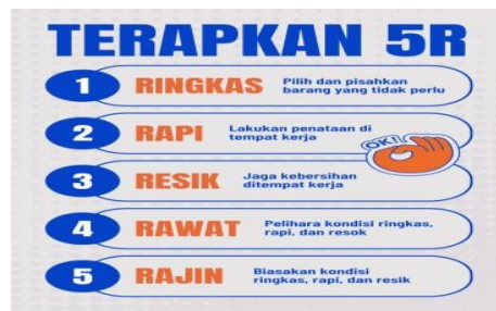
Gambar 4: Poster 5R