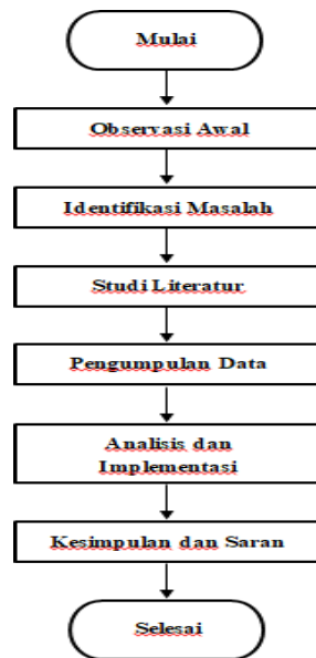
Gambar 2: Flowchart Penelitian

Pada alur pengujian dibawah ini menunjukkan tahapan untuk mencapai tujuan penerapan 5R untuk meningkatkan produktivitas kerja di perusahaan. Flowchart penelitian dapat dilihat pada Gambar 2 di bawah ini.