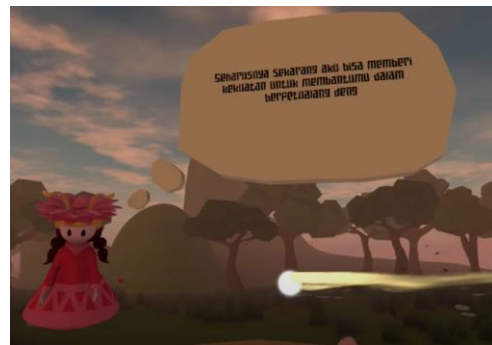
Figure 3.1.2 Trail Effect penunjuk rotasi kearah peri