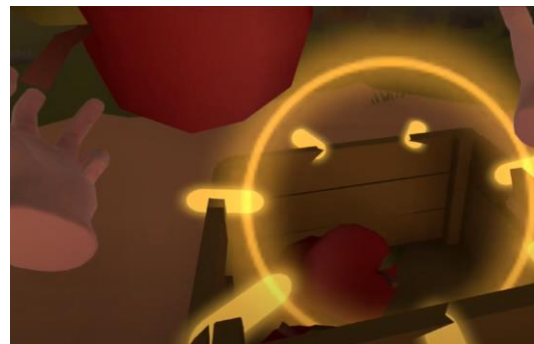
Figure 3.1.4 Ledakan (flash) saat memasukkan apel kedalam box