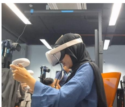
Figure 3.2.3. 1 “Wuuu... So satisfying” (R4 Saat memasukkan apel kedalam box)

“Jadi kita berasa kayak dapet sesuatu pas masukin apel itu.” (R3)