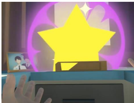
Figure 3.1.1 Ledakan peri saat pergi masuk kedalam map