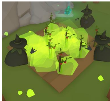
Figure 3.1.6 Asap beracun