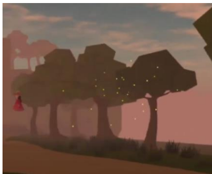
Figure 3.1.3 Kunang-kunang