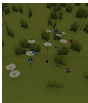
Figure 3.1.7 Kupu-kupu