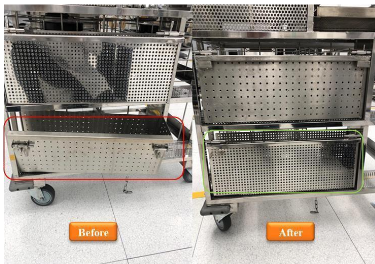
Gambar 4. Keadaan Laci Penyimpanan Metal Troli Sebelum dan Sesudah diperbaiki.

Gambar 4 menunjukkan proses perawatan troli industri. Pada foto tersebut, kondisi sebelumnya menunjukkan tempat penyimpanan Metal di troli yang tampak miring dan tidak stabil. Jika tidak diperbaiki maka akan timbul dampak negatif. Dalam keadaan perbaikan, ini menunjukkan tempat penyimpanan Metal di troli telah dinaikkan dan dikunci, sehingga tampilan tetap aman dan tanpa masalah.