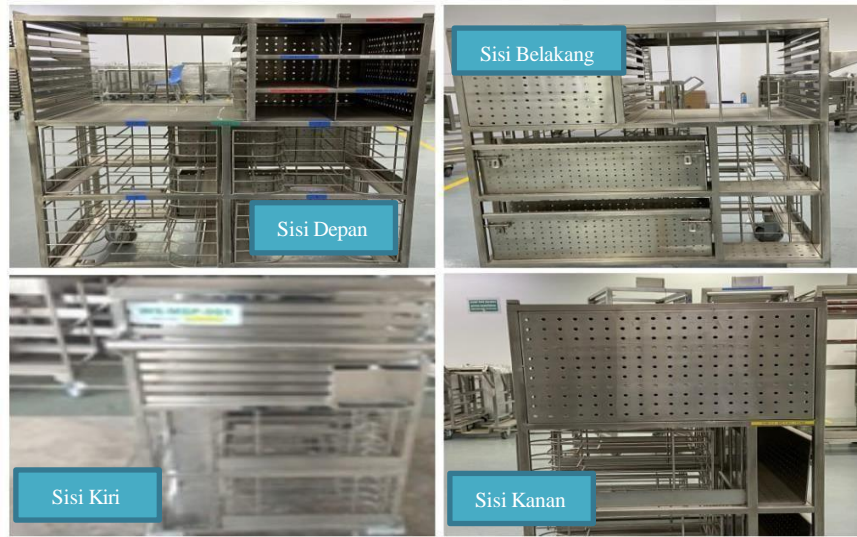
Gambar 8. Troli Industri dalam Keadaan Baik.

Gambar 8 dengan jelas menunjukkan sisi depan, belakang, kiri dan kanan. Setiap sudut yang ditampilkan menggambarkan bahwa troli ini telah dirawat dengan baik. Dengan detail yang jernih dan tajam, gambar ini memastikan troli dalam kondisi optimal, siap digunakan tanpa hambatan apa pun.