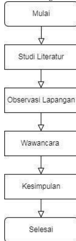
Gambar 1. Flowchart Metodologi Penelitian

Dalam mencapai hasil penelitian ini, ada beberapa tahap yang dilaksanakan yaitu: