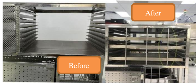
Gambar 2. Keadaan Penyangga Sebelum dan Sesudah diperbaiki.

Gambar 2 menunjukkan proses maintenance pada troli industri. Pada foto sebelum diperbaiki hanya terlihat semua penyangga patah, setelah diperbaiki menjadi tiga penyangga. Fungsi dari penyangga adalah untuk menjaga tray agar tidak terjatuh saat troli bergerak. Tray adalah tempat IC sehingga penyangga itu penting untuk di perbaiki. Hal ini dilakukan untuk memastikan troli industri beroperasi secara efisien dan menghindari dampak negatif terhadap proses produksi.