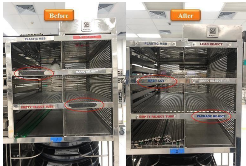
Gambar 5. Kondisi Label Laci Troli Sebelum dan Sesudah

Dalam Gambar 5, pada sisi kiri terlihat keadaan label yang hilang dan tidak dapat dibaca lagi. Hal ini mungkin menunjukkan kekurangan pemeliharaan pada troley. Namun, pada sisi kanan gambar, troley terlihat memiliki label yang jelas dan bisa dibaca. Hal ini menggambarkan bahwa troley tersebut menerima perawatan yang baik.