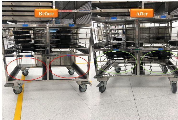
Gambar 3. Keadaan Laci Penyimpanan LOT Troli Sebelum dan Sesudah diperbaiki.

Gambar 3 menunjukkan proses maintenance pada troli industri. Pada foto sebelum diperbaiki, terlihat 2 laci stroller terjatuh dan patah. Namun setelah perbaikan, kedua laci troli dipasang kembali dan tempat penyimpanan LOT pada troli telah diperbaiki.