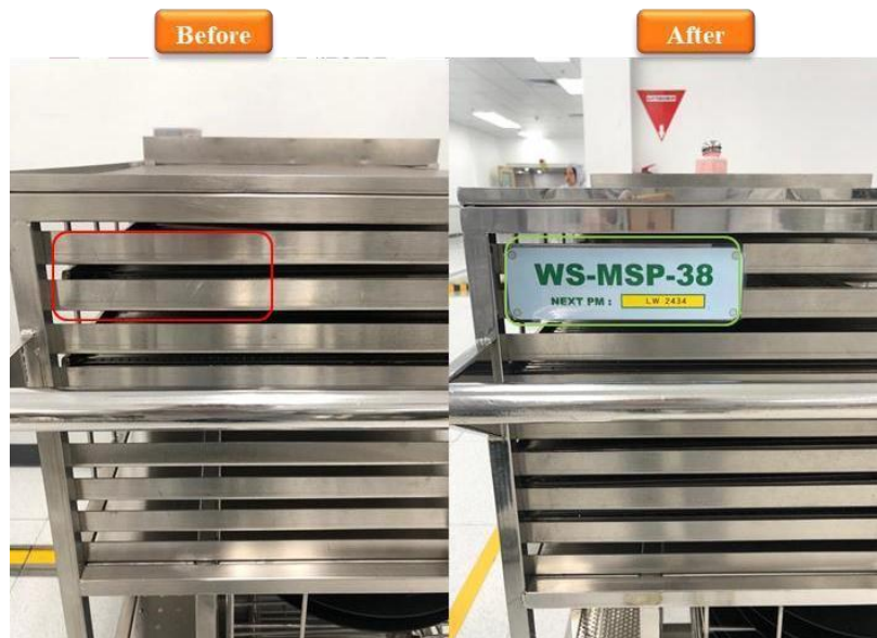
Gambar 6. Kondisi Nametag Troli Sebelum dan Sesudah Pemasangan

Pada Gambar 6, gambar sebelah kiri tidak terdapat Nametag pada troli, menggambarkan bahwa troli kurang diperhatikan. Namun, gambar di sebelah kanan menunjukkan bahwa troli