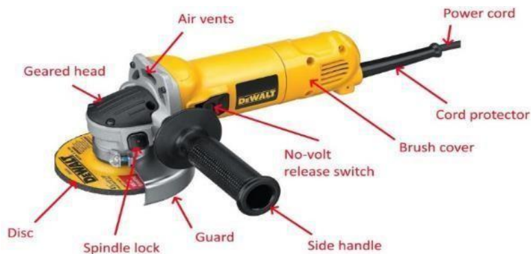
Gambar 8. Komponen pada mesin gerinda[8]

Berikut penjelasan pada komponen mesin gerinda beserta fungsinya, diantaranya sebagai berikut: