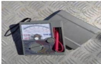
Gambar 4 Multimeter Tester