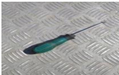
Gambar 5. Obeng plus