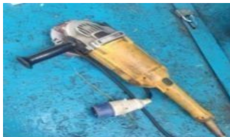
Gambar 1. Mesin Grinding

Oleh karena itu penulis ingin melakukan analisis serta pembahasan dari data inspeksi dan data kerusakan yang diperoleh dari lapangan kerja pada mesin gerinda bermerek Stanley STGL2218 - 2200W 180mm, RPM 8500. untuk mengetahui perbaikan yang tepat dari kerusakan-kerusakan yang terjadi serta mengestimasi biaya yang dikeluarkan untuk perbaikan itu sendiri. Dapat dilihat gambar 1 di bawah ini contoh dari mesin grinding :