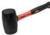
Gambar 7. Palu karet ( Rubber hammer )[7]