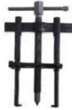
Gambar 6. Tracker Bearing[6]