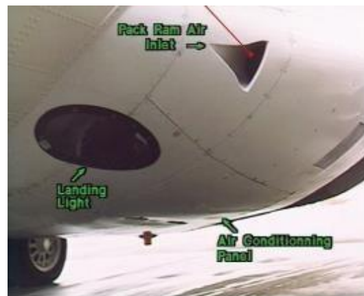
Gambar 1: Air conditioning 72-500/600 [1]

Di masa sekarang, ada beberapa pesawat yang dirancang untuk bisa berpergian ke tempat-tempat terpencil, salah satunya adalah pesawat ATR72-500/600 karena memiliki kapabilitas dan fleksibilitas yang mumpuni. Selain memerhatikan aspek keamanan pada pesawat, penerbangan juga harus memerhatikan aspek keselamatan pada manusia salah satunya sistem air conditioning . Pesawat ATR72-500/600 memiliki sistem pengkondisian udara yang berbeda dengan sistem yang dipakai di rumah-rumah, perkantoran ataupun kendaraan lainnya. Karena fungsi yang dibutuhkan lebih kompleks dari sistem pada umumnya, tidak hanya sebagai pendingin udara tetapi juga sebagai pengatur tekanan udara, pengatur suhu, sirkulasi, kelembaban, dan kebersihan didalam kabin pesawat. Sistem air conditioning juga berperan penting dalam menjaga kenyamanan penumpang awak kabin dalam penerbangan.