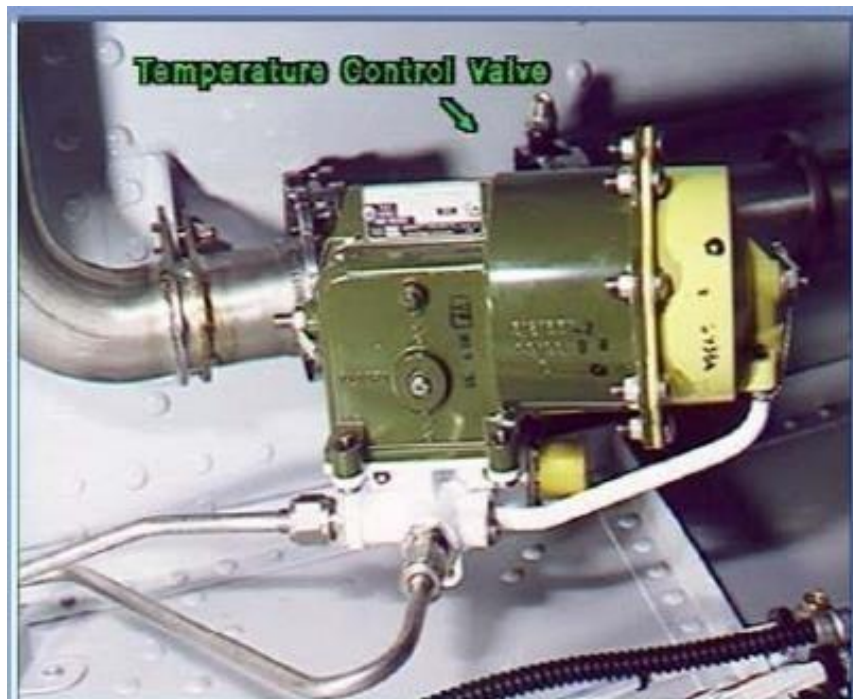
Gambar 6: Temperature Control Valve[1]