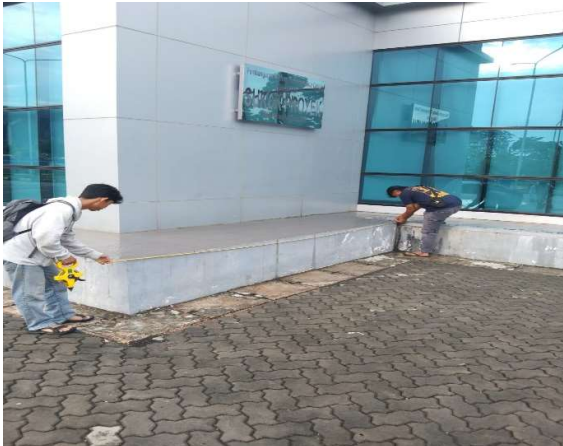
Gambar 6. Pengukuran Menggunakan Meteran

Pengukuran bangunan dilakukan agar mendapatkan ukuran sesuai pada aktual untuk dapat dibandingkan dengan data ukuran pada 3D model yang diperoleh melalui drone. Pengukuran ini di ambil dengan menggunakan meteran 100m dan meteran 8m. Data yang di ambil dengan meteran adalah data yang di anggap benar.