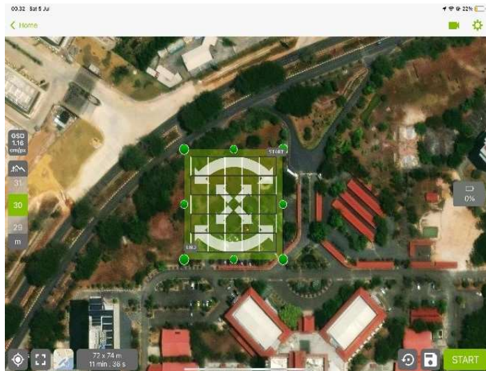
Gambar 4. Alur Terbang Double Grid

Alur terbang double grid adalah salah satu metode untuk pemetaan pada 3D model. Metode ini membagi area kerja menjadi kotak-kotak (Grid) yang saling berpotongan. Metode ini juga dapat menghasilkan visualisasi yang jelas sehingga 3D model lebih halus. Pengaturan kamera dengan sudut 70 derajat, front overlap 80%, side overlap 70%, dan dengan speed normal.