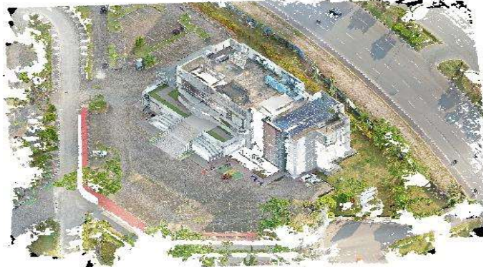
Gambar 9. Model 3D

Klasifikasi dilakukan untuk mengetahui sejauh mana model 3D hasil pemrosesan data drone dapat memenuhi klasifikasi Level of Detail (LoD) dalam Building Information Modeling (BIM). LoD merupakan indikator sejauh mana informasi spasial dan non-spasial dari sebuah objek bangunan direpresentasikan secara digital. Dalam penelitian ini, klasifikasi LoD yang digunakan mengacu pada standar BIM Forum yang membagi LoD dari tingkat paling dasar (100) hingga paling detail (500).