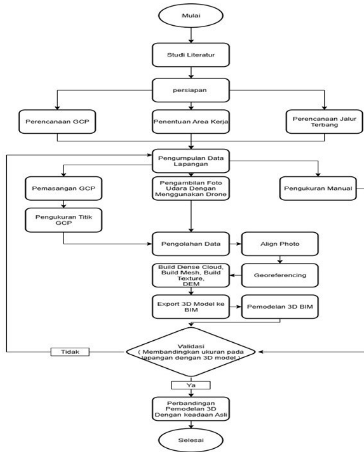
Gambar 1. Diagram Alir