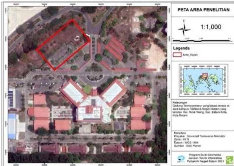
Gambar 2. Peta Area Penelitian