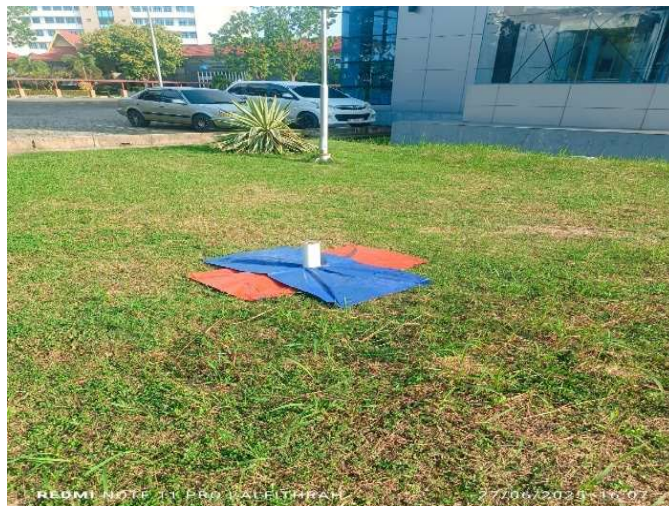
Gambar 3. Titik GCP

Ground control point (GCP) adalah titik kontrol yang digunakan untuk mengkoreksi foto udara, agar foto udara dapat memiliki ukuran atau posisi yang sesuai pada aktualnya. Titik GCP diambil menggunakan GPS Geodetik. Adapun peraturan terkait GCP yang diterbitkan oleh BIG.